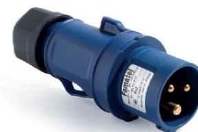
Ref. / Item 13200